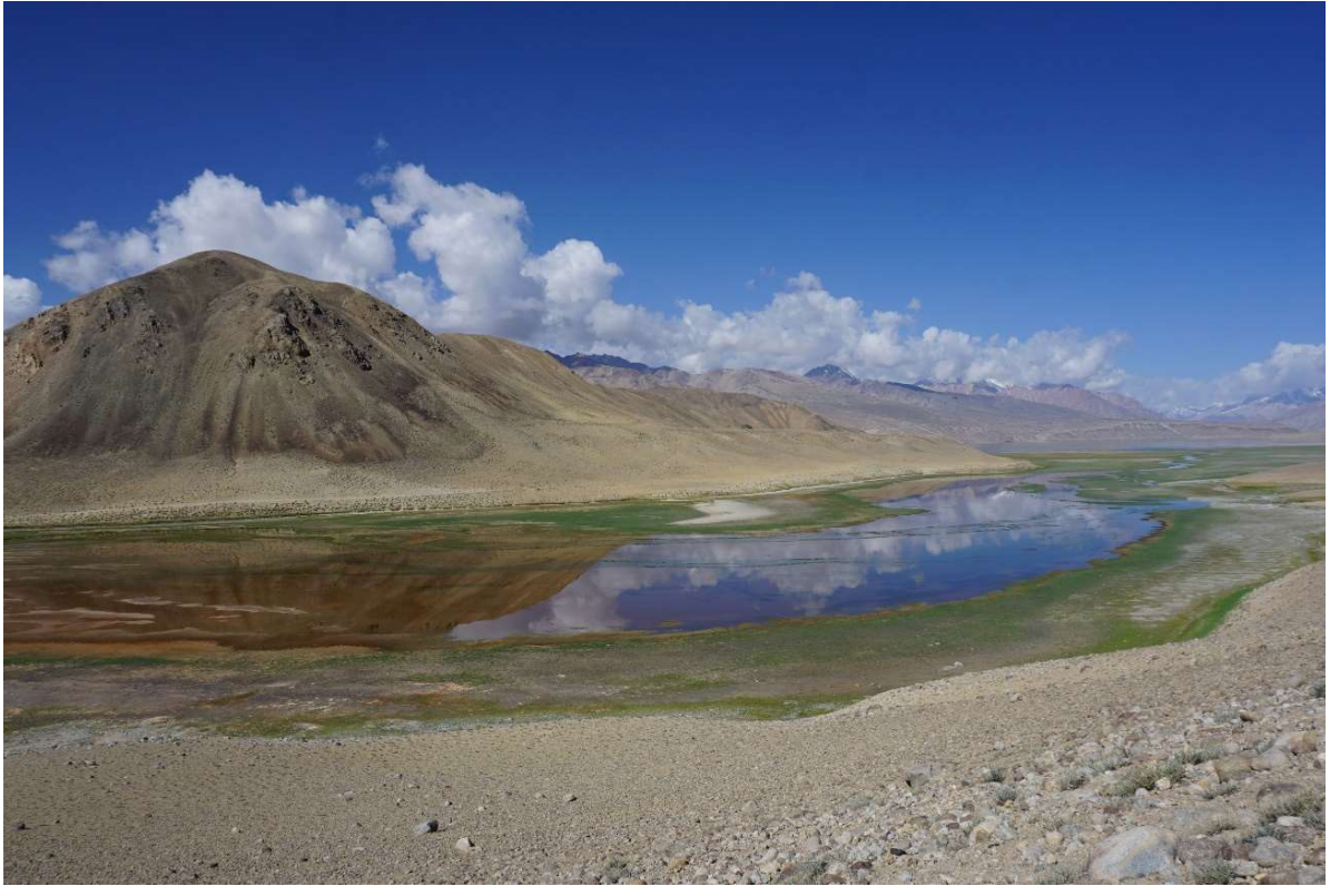
Llac Yashilkul situat a 3719m