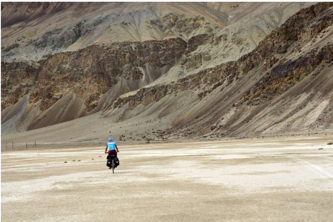
Sortim de la carretera principal per dirigir-nos al poble de Bulunkul