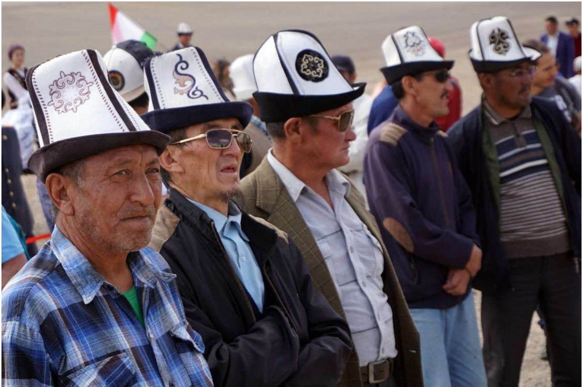
Homes Kirguis al poble de Murghab