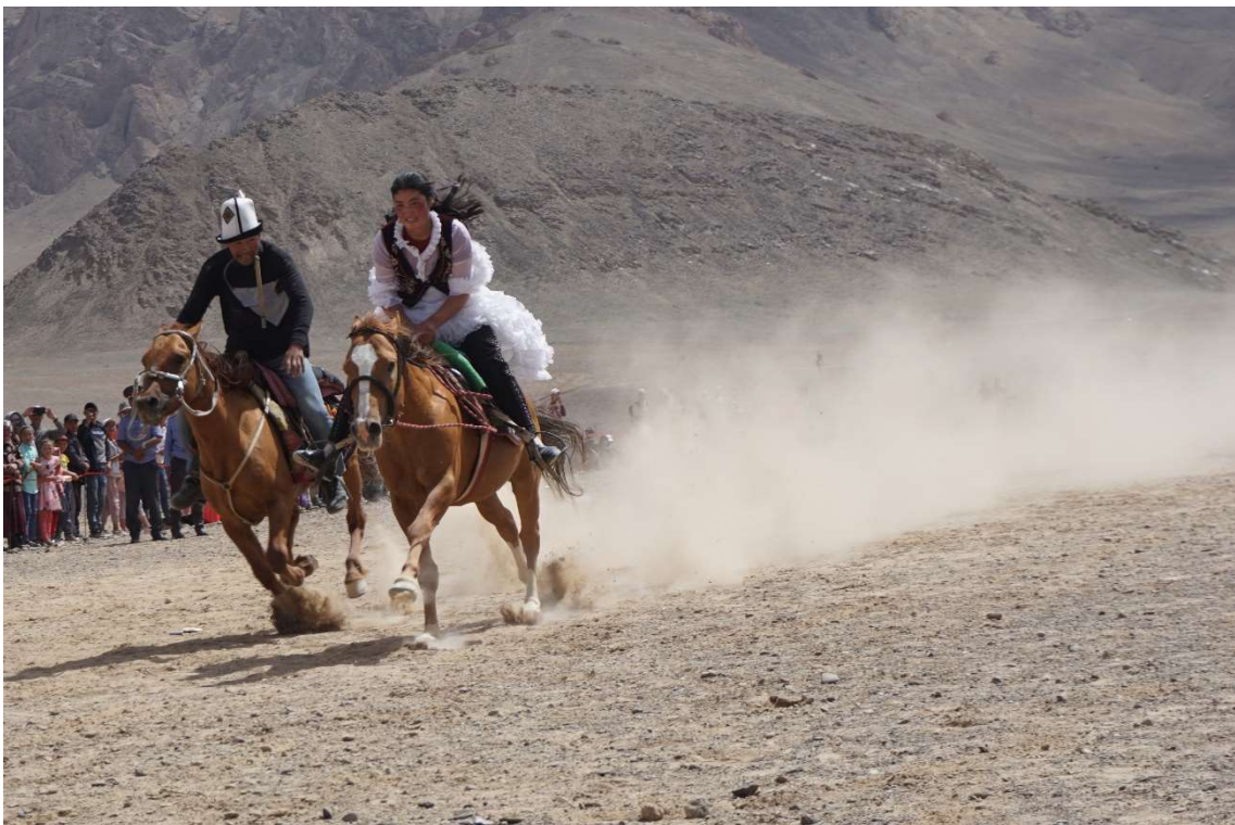
Curses de cavalls i rituals d'aparellament eqüestre que es poden veure al festival At Chabysh