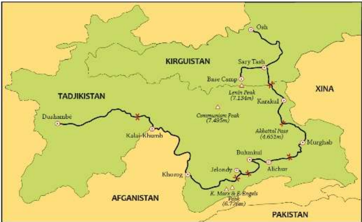
Mapa de la ruta seguida