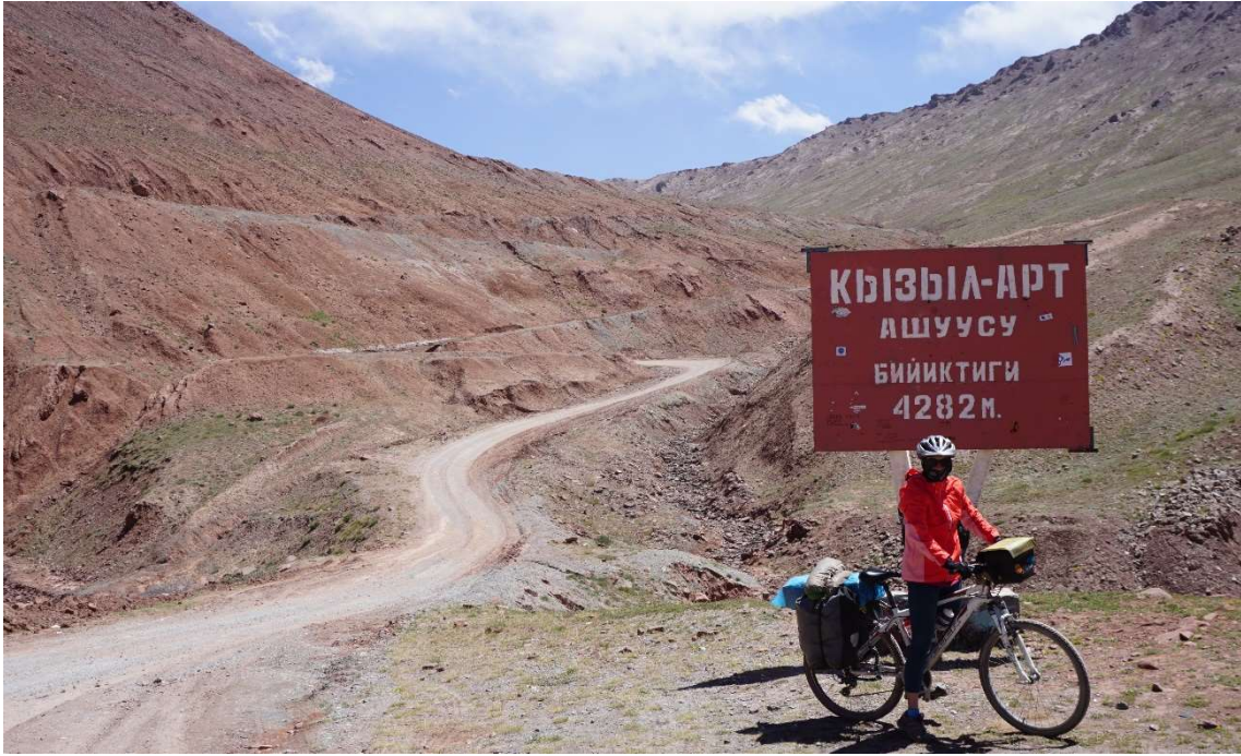
Kizil-Art (4.336m), un dels 9 colls de muntanya més impressionants del Pamir.