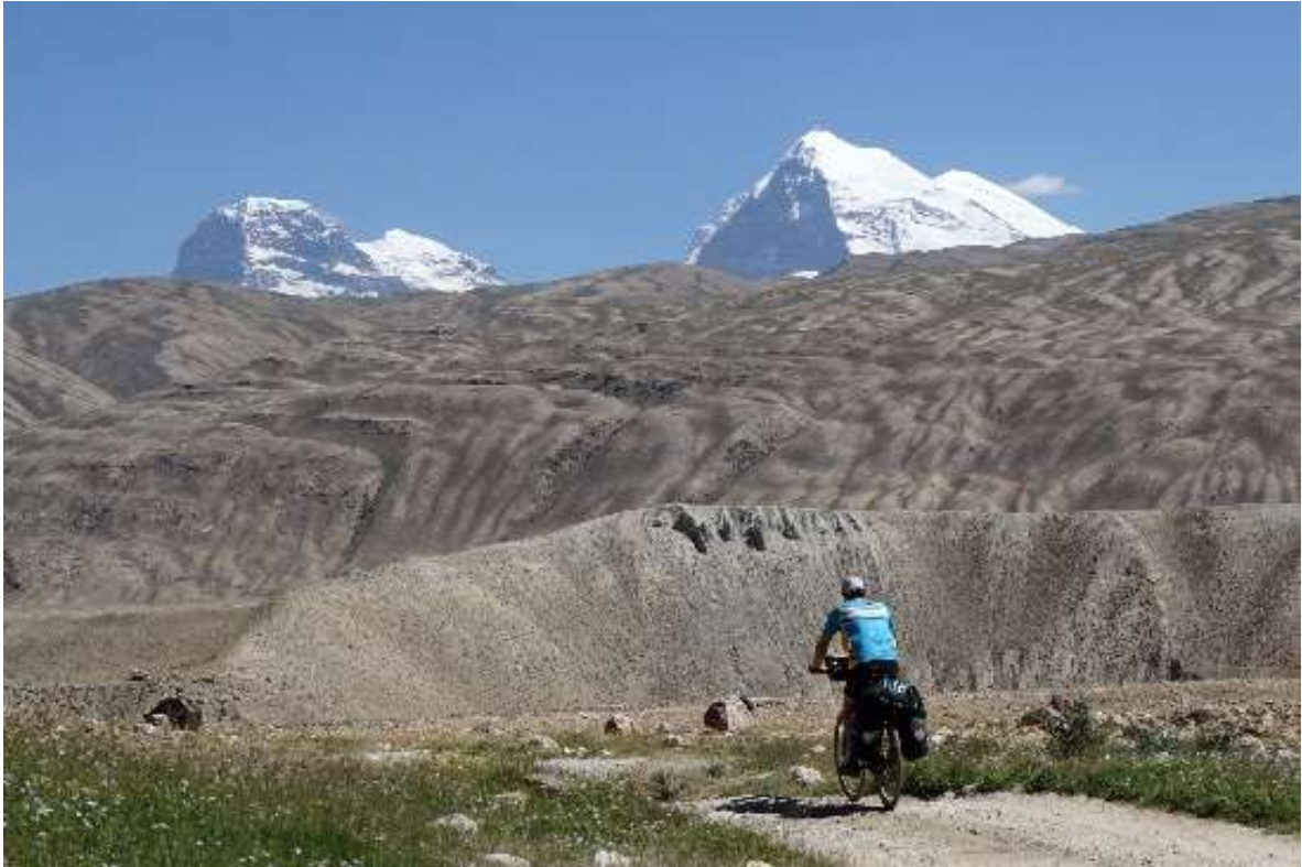
Cims K. Marx i F. Engels de 6.726m i 6.507m.