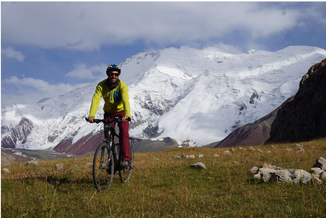
Massís del cim Lenin