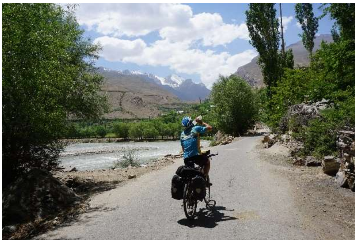
Aprop de la ciutat de Khorog